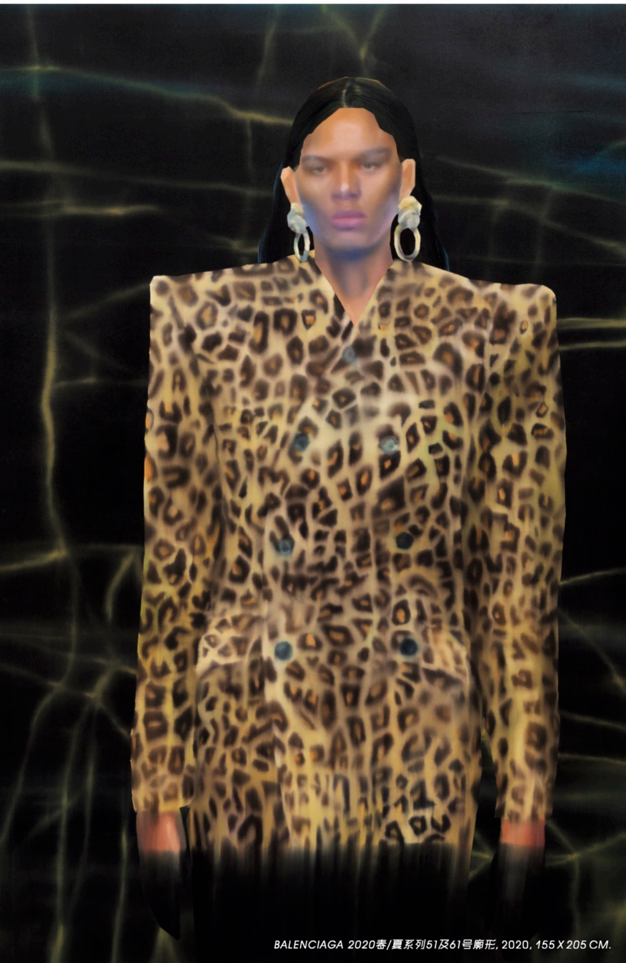
BALENCIAGA 2020春/夏系列51及61号廓形, 2020, 155 X 205 CM.