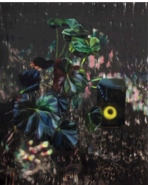
罗基特小夜曲 II, 2020, 布面:油画, 170 X 140 CM; 右页: 兰花研究 II, 2020, 布面:油画, 85 X 58 CM.

RUTE MERK 1991年出生于立陶宛,目前在柏林生活和工作。她2013年毕业于维尔纽斯艺术学院绘画系,目前正在攻读慕尼黑美术学院绘画系的学位。她的绘画创作中性别与身份概念不再清晰,写实科幻和虚拟现实被结合在一起,与90年代后期RPG (ROLE-PLAYING VIDEO GAME的缩写,角色扮演游戏)的独特美学遥相呼应。MERK将主题置于看似电脑合成的图片场景中,深入探索人物与给定图像引发的幻象之间的貌离神合,以及这些无名人物的虚拟存在是否意味着人类灵魂在科技成就中得以轮回。人类、真实、虚拟和科技:让我们一起寻访RUTE MERK的创作空间。