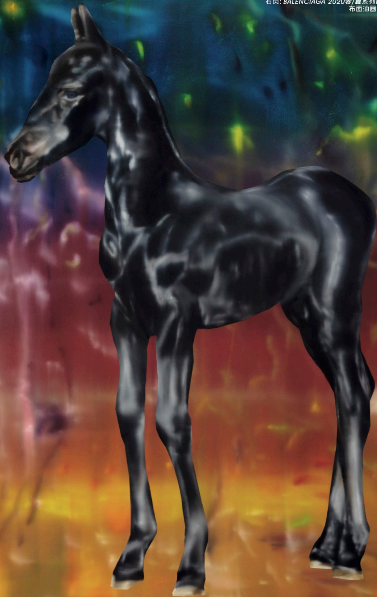
弗里塞, 2020, 布面油画, 185 X 140 CM. 右页: BALENCIAGA 2020春/夏系列89号廓形, 2020, 布面油画, 220 X 220 CM.